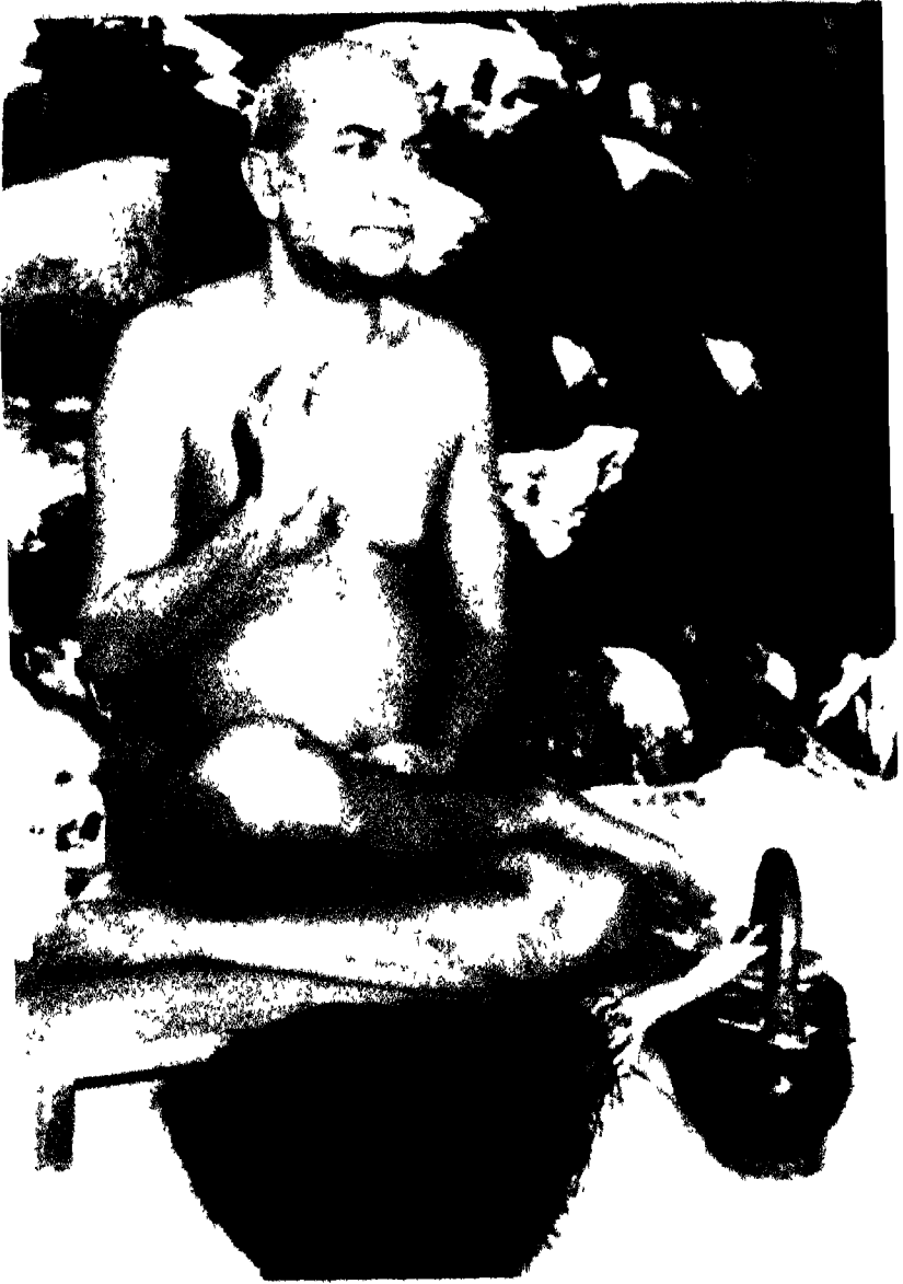
आचार्य भरतसागरजी महाराज